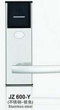
JZ 600-Y (不锈钢-银色) Stainless steel