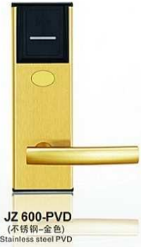
JZ 600-PVD (不锈钢-金色) Stainless steel PVD